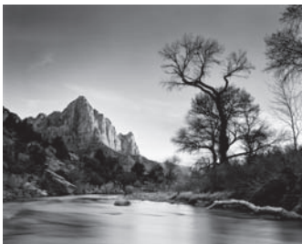
柯达专业胶卷 T-MAX 100