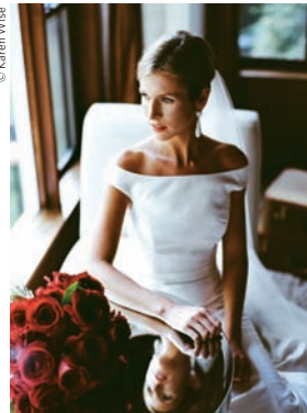
柯达专业胶卷 PORTRA 400