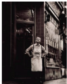
柯达专业胶卷 TRI-X 400