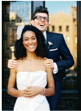
柯达专业胶卷 PORTRA 160