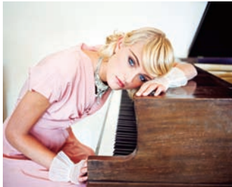
柯达专业胶卷 PORTRA 400