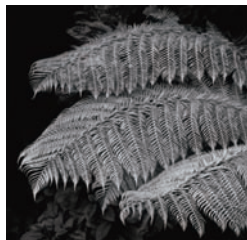
柯达专业胶卷 T-MAX 400